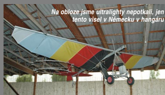
Na obloze jsme ultralighty nepotkali, jen tento visel v Německu v hangáru

Prvních 150 km nás čekala protrhávající se nízká oblačnost, pak už jenom modro. Po vzletu z Kunovic jsme letěli nad krásnými mraky. Následovalo přistání na mezinárodním letišti Brno-Tuřany, podání letového plánu do Schwäbisch Hall v Německu a příprava další etapy. Za půl hodiny už jsme zase seděli v letadlech. Letěli jsme přes Blatnou a za chvíli již pře-