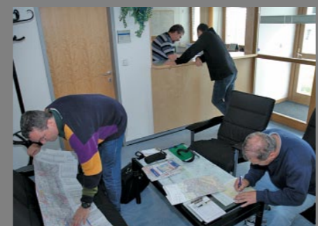
Briefing v Brně

Vzal jsem si na pomoc techniku zvanou „voice dialog“ – to si jednoduše představíte, že můžete v místnosti vidět například postavy: sebe, svou práci, odpočinek, čas a tak podobně. Standardně vás procesem