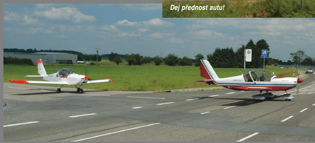
Dej přednost autu!

Pro mě jako fotografa bylo skvělé letět s dobrými piloty – když se mi někde líbilo, požádal jsem je, oni udělali bez problémů na chvíli pěknou sevřenou skupinu, a tak nám cesta hezky ubíhala. Nad Německem jsme měli příležitost vychutnat si laskavou pozornost dispečerů. V hezkém termickém počasí