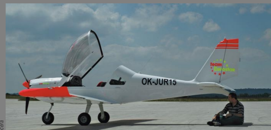
Od podání letového plánu musíme počkat 30 minut, což stačí tak akorát na rychlý oběd