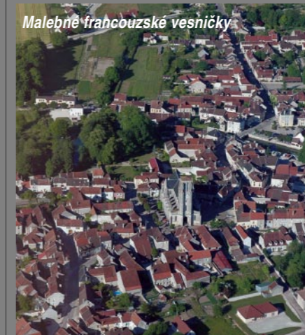
Malebně francouzské vesničky

Po doplnění paliva a podání letového plánu do Francie jsme poobědvali ve stínu našich letadel a pak se vydali na další cestu. Cestou bylo zajímavé sledovat, jak se mění krajina v souladu s obecně známými povahami jednotlivých národů. Po přeletu hranice s Německem nastal rázem pořádek. Všechna políčka a celá krajina byla ve srovnání s naší organizovaná,